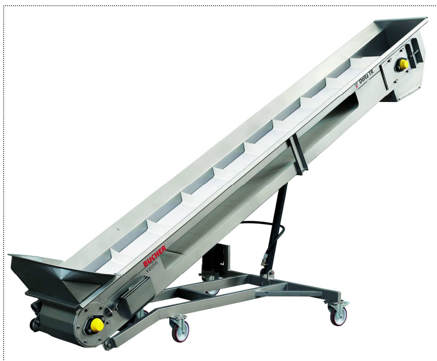
Delta TRE 300 с приемным бункером под гребнеотделителем