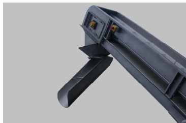
Направляющий вращающийся желоб (опция)