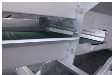
Скребок нижней ветви конвейера