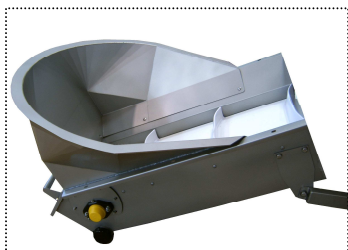
Приемный бункер под гребнеотделителем (опция)