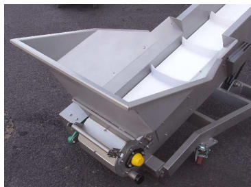
Приемный бункер под сортировочным столом